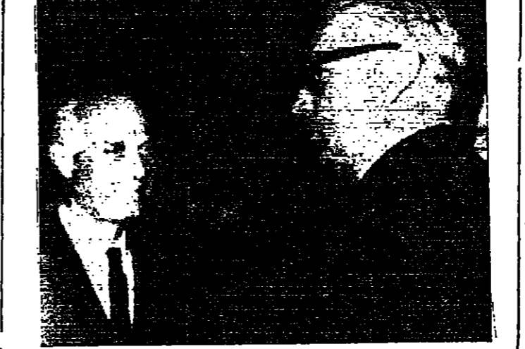
صورة لاسلكية خاصة بالدستور من اليونانياتديرس نطل مندوبي الجمهورية المتحدة وروسيا خلال اجتماع مجلس الامن صباح امس

وقالت انها تشكل علة غير بارزة في المواجهة العسكرية مع اسرائيل . شروط وقف النار واوردت معلم صحف القاهرة تقارير كاملة عن اشتباك يوم الاحد الماضي . واجتاحت كلها على ان اسرائيل هي التي القاة واشادت الصحفية بهذه العملية